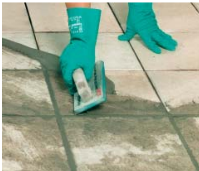
PCI-Flexfuge è cremoso e di facile applicazione.

5 Dopo l'asciugamento togliere con una spugna inumidita il velo di cemento residuo.