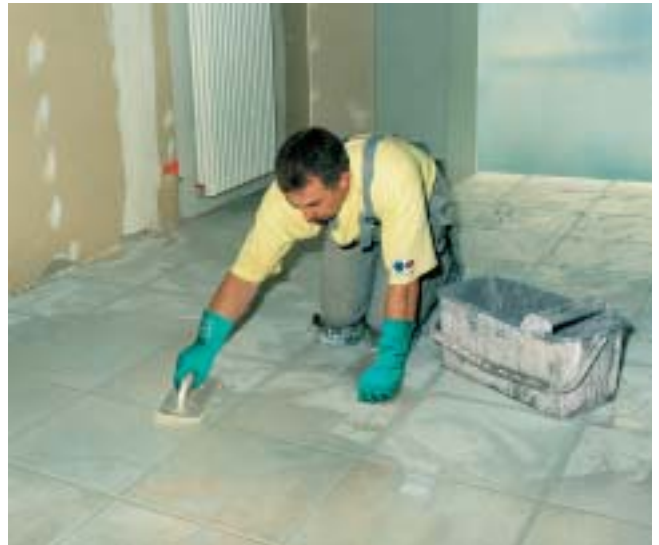
Con PCI-Flexfug si possono eseguire fughe esenti da fessurazioni da 2 a 10 mm e da 3 a 15 mm di larghezza (dipendentemente dal colore).