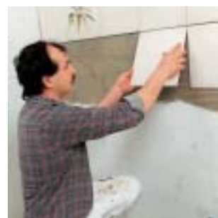
Posa di piastrelle con PCI-Flexmörtel e PCI-Flexmörtel-Schnell su sottofondi deformabili come, ad esempio, il calcestruzzo.