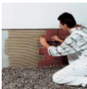
Posa di rivestimenti ceramici nell'area del basamento con PCI-Flexmörtel e PCI-Flexmörtel-Schnell.