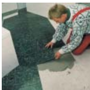
Incollaggio sicuro su massetti cementizi con PCI-Flexmörtel e PCI-Flexmörtel-Schnell.

5 Posare e allineare le piastrelle muovendole leggermente.