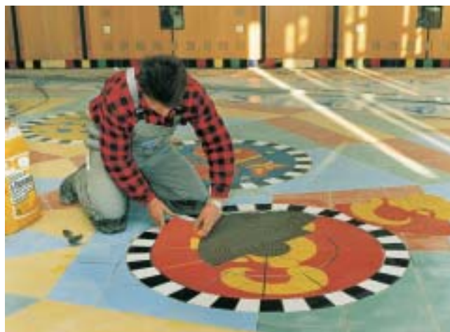
Posa sicura di piastrelle con PCI-Flexmörtel e PCI-Flexmörtel-Schnell.