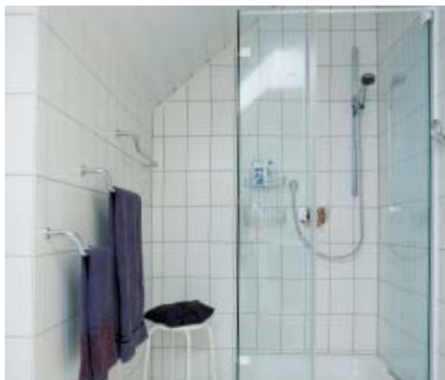
Con PCI-Aquafug si possono stuccare in modo sicuro rivestimenti ceramici in docce.